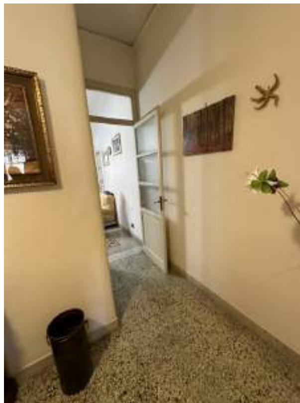
Foto 5 -La porta della zona soggiorno/pranzo attigua alla sala