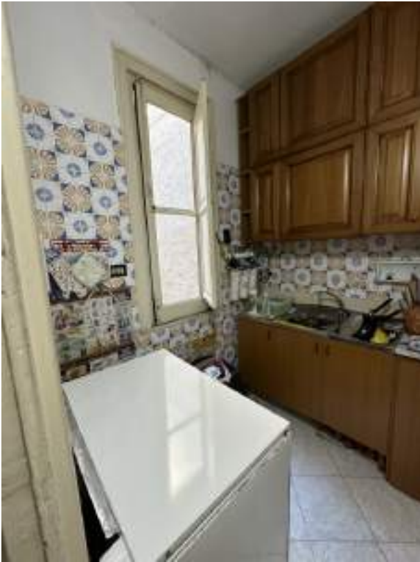
Foto 8 -La cucina con finestra all'interno del cavedio

INDIVIDUAZIONE SITO E REPORT FOTOGRAFICO