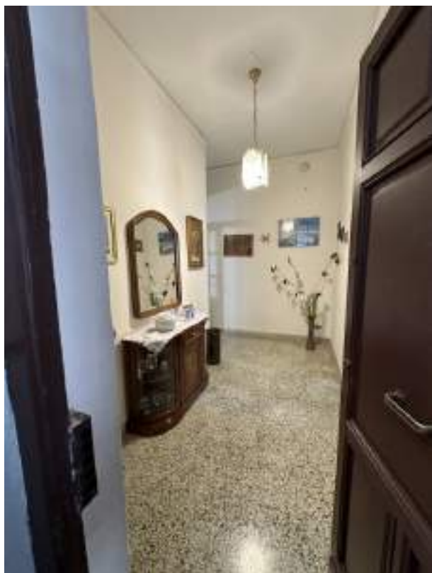
Foto 4 -La porta d'ingresso e sala

INDIVIDUAZIONE SITO E REPORT FOTOGRAFICO