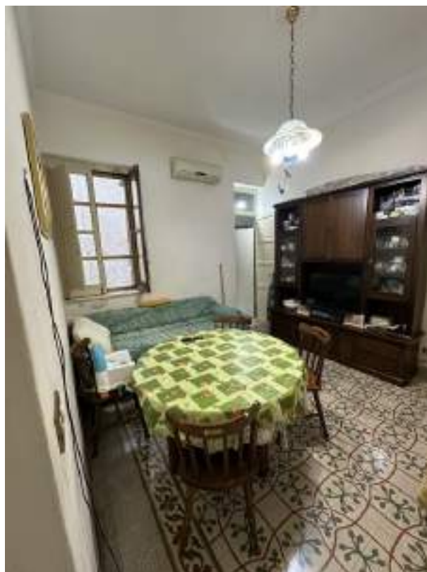
Foto 7 –Vista della zona pranzo con finestra nel cavedio, attigua alla cucina