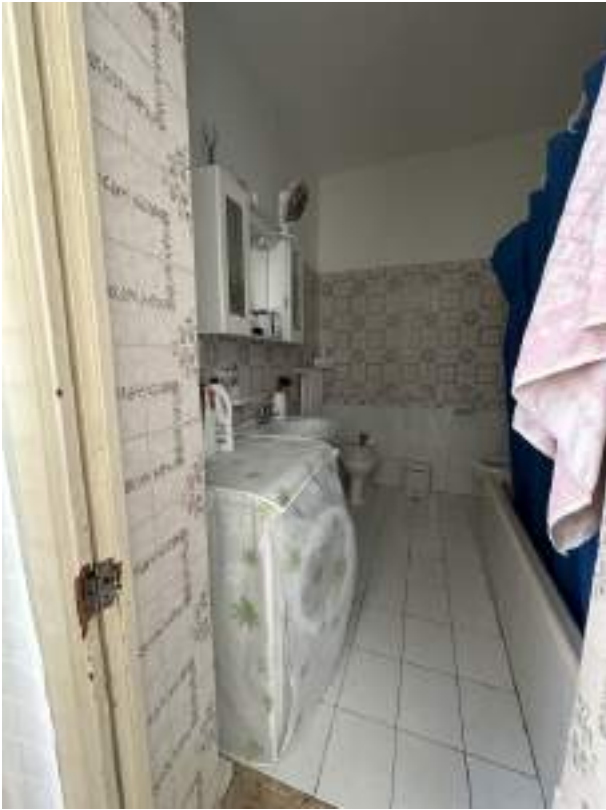
Foto 12 -Il secondo wc privo di finestratura

INDIVIDUAZIONE SITO E REPORT FOTOGRAFICO