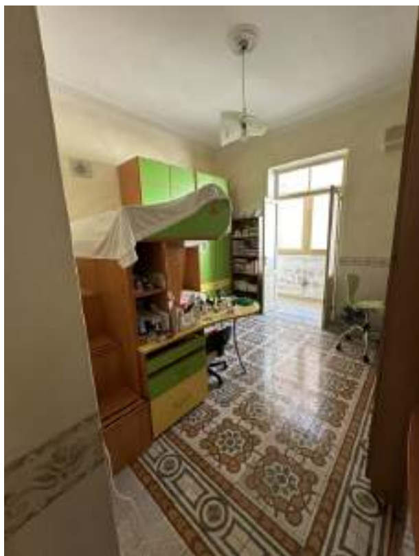
Foto 10 -La camera con esposizione nella veranda interna

INDIVIDUAZIONE SITO E REPORT FOTOGRAFICO