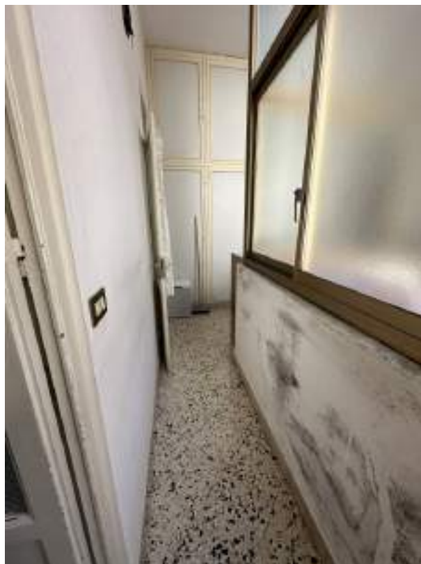
Foto 11 -Vista di parte della veranda interna che conduce al secondo wc.