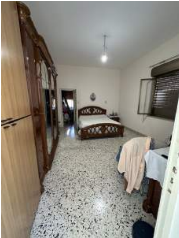
Foto 14 -La camera matrimoniale con finestra su prospetto interno

INDIVIDUAZIONE SITO E REPORT FOTOGRAFICO