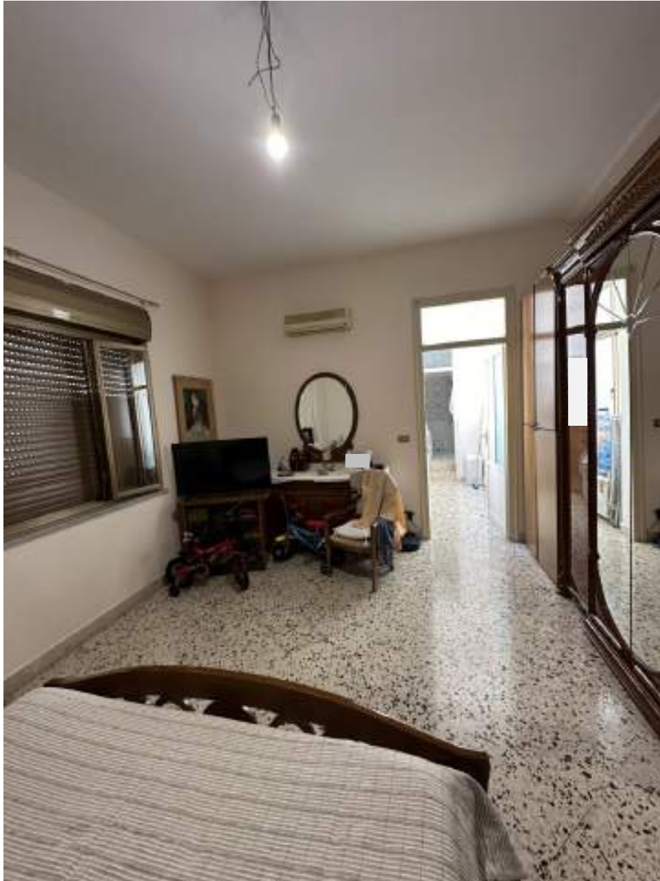
Foto 16 -Altra vista della camera matrimoniale

INDIVIDUAZIONE SITO E REPORT FOTOGRAFICO