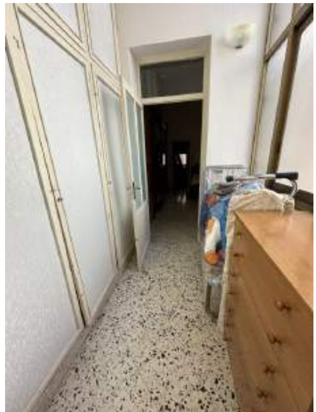
Foto 13 -L'altra parte della veranda che conduce alla seconda camera.