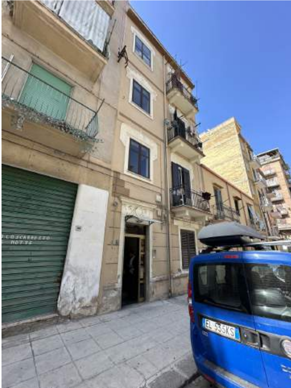
Foto 1 -Individuazione sul prospetto di via Giuseppe Crispi dell'immobile oggetto del procedimento

INDIVIDUAZIONE SITO E REPORT FOTOGRAFICO