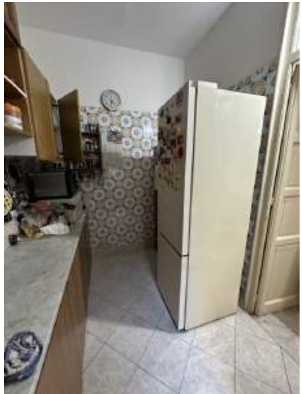
Foto 9 -Altra vista della cucina